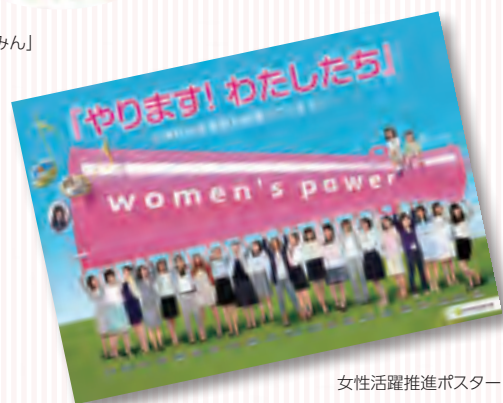
女性活躍推進ポスター

女性活躍推進の効果を一段と発揮するため、職場単位で啓発活動を行うことを目的として、10支店（札幌、仙台、さいたま、東京、横浜、名古屋、大阪、広島、高松、福岡の各支店）に設置した「女性活躍推進地域委員会」を中心に、全支店において、自発的な活動を推進しています。