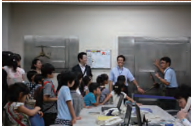
家族の職場参観日の様子